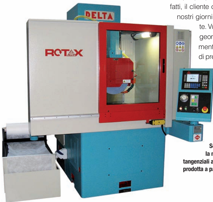
Sempre a montante mobile è la nuova linea di rettificatrici tangenziali a tavola rotante Rotax prodotta a partire dal 2010 da Delta

Tra le più vendute in assoluto ci sono le rettificatrici tangenziali serie MINI. Tra queste la Mini 12. Semplice e funzionale, Mini 12 soddisfa appieno le attuali richieste della clientela. La sua architettura a montante mobile è caratterizzata da una struttura interamente realizzata con fusioni di ghisa Meehanite stabilizzata. Con il montante mobile "la testa non cade", infatti, vengono eliminati in partenza tutti i problemi di caduta della testa, legati alla corsa trasversale, che si verificano normalmente nelle rettificatrici a testa mobile (flessione che aumenta con lo sbraccio della testa e relative problematiche di compensazione). In più, è dotata di sostentamento idrostatico su tutti gli assi-macchina (tavola, montante e testa) con guide in presa integrale. Questo significa: eliminazione degli attriti radenti e massimo sfruttamento di tutta la potenza installata, usura zero e movimenti estremamente regolari in assenza di andamento a scatti (stick-slip). «Ne è una prova il fatto che è sufficiente la pressione di un dito che agisce sulla tavola per spostare carichi considerevoli», spiega il manager. «Inoltre, per garantire la massima precisione, tutte le guide sono in presa integrale, quindi: la tavola appoggia sul basamento per tutta la corsa longitudinale. Lo stesso criterio viene applicato al montante ed alla testa». La linea mandrino, progetto originale Delta, è frutto di anni di ricerca e sperimentazioni. Anteriormente è supportato