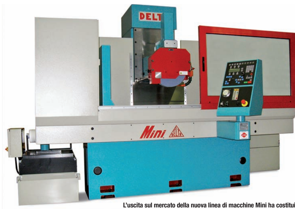
L'uscita sul mercato della nuova linea di macchine Mini ha costituito una nuova sfida per Delta, in quanto è stato introdotto il montante mobile anche su rettificatrici per superfici piane di ridotte dimensioni

Gli ultimi anni sono stati impegnativi per tutti, ma per Delta sono stati anche quelli della spinta all'innovazione. Nel 2009, infatti, è